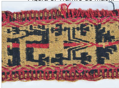
Figura 3: Trariwe de machi