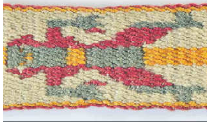
Figura 6: Trarilonko pehuenche, hombre con chiripa