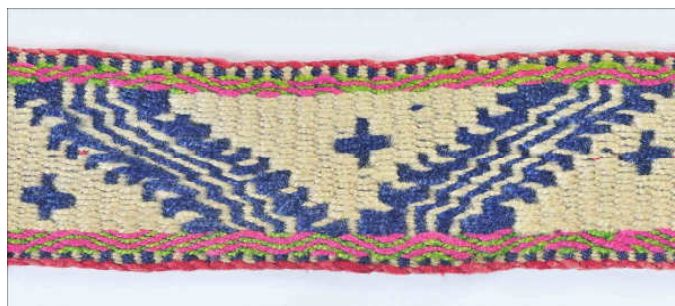
Figura 5: Trariwe mujer joven