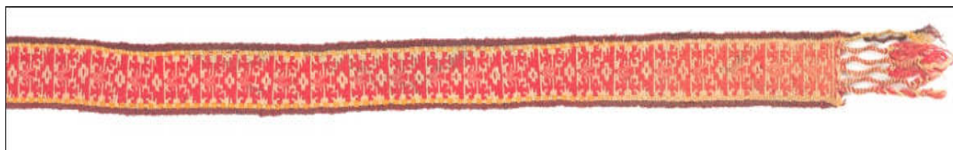
Figura 4: Trariwe mujer kimche

En la siguiente figura la faja representa a una mujer kimche o sabia, en ella se observa el icono central en color rojo con la figura reiterada del lukutuel a lo largo del trariwe sobre lana natural, los bordes presentan los colores burdeo y anaranjado. Estas fajas no contienen color negro.