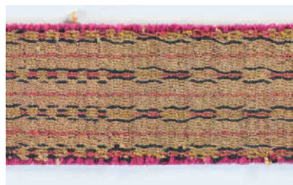
Figura 1: TrariweLafkenche